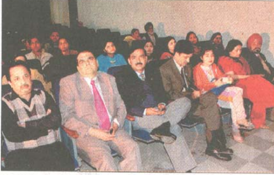
■ वर्ल्ड कैंसर डे पर रेडक्रास भवन में लगाए गए कैंप में शामिल लोग।